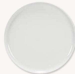
Tallrik flat - Ø 19 cm Art.nr 26351