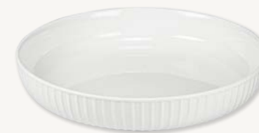
Tallrik djup - Ø 19 cm Art.nr 26360