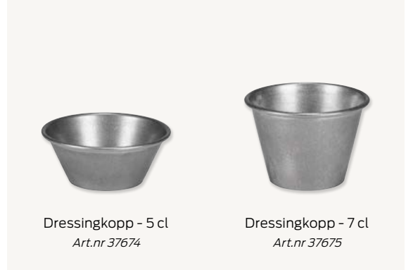
Dressingkopp - 5 cl Art.nr 37674