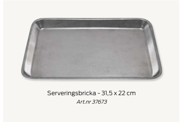
Serveringsbricka - 31,5 x 22 cm Art.nr 37673