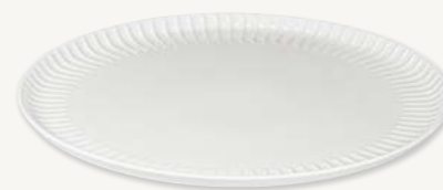
Tallrik flat - Ø 21 cm Art.nr 26355