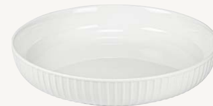
Tallrik djup - Ø 22 cm Art.nr 26359