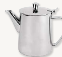
Kaffekanna - 1,0 L Art.nr 54098

Bestick - Paris Matkniv - 227 mm Art.nr 13325 Matgaffel - 205 mm Art.nr 13326 Matsked - 200 mm Art.nr 13324 Kaffesked - 140 mm Art.nr 13320