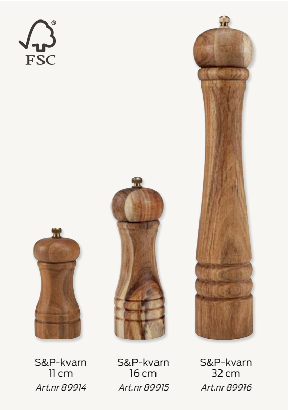
S&P-kvarn 11 cm Art.nr 89914