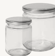
Serveringsburk 240 ml - Art.nr 52981 450 ml - Art.nr 52982