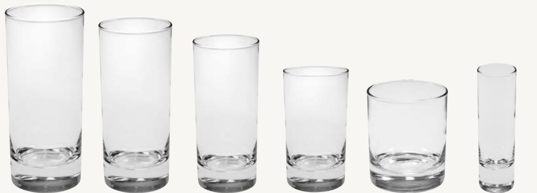
Drinkglas - 33 cl Art.nr 52773 Drinkglas - 29 cl Art.nr 52772 Selterglas - 22 cl Art.nr 52771 Selterglas - 16 cl Art.nr 40367 Whiskyglas - 20 cl Art.nr 52770 Snapsglas - 6 cl Art.nr 40375