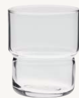
Dricksglas - 27 cl Art.nr 52969