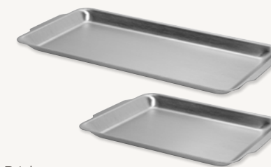
Bricka 32 x 16 cm - Art.nr 65018 22,5 x 14,5 cm - Art.nr 65019