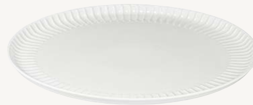
Tallrik flat - Ø 26,5 cm Art.nr 26354