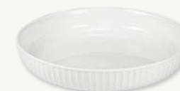
Tallrik djup - Ø 12,5 cm Art.nr 26361