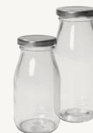
Serveringsflaska 200 ml - Art.nr 52984 250 ml - Art.nr 52983