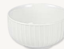
Skål - Ø 11 cm Art.nr 26357