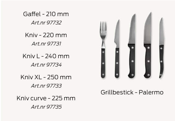
Gaffel - 210 mm Art.nr 97732