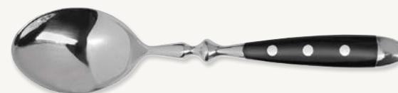
Matsked - 195 mm Art.nr PT03TSFE