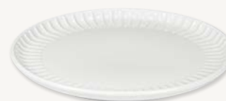
Tallrik flat - Ø 15 cm Art.nr 26356