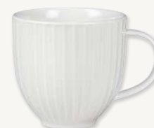
Mugg - 35 cl Art.nr 26358