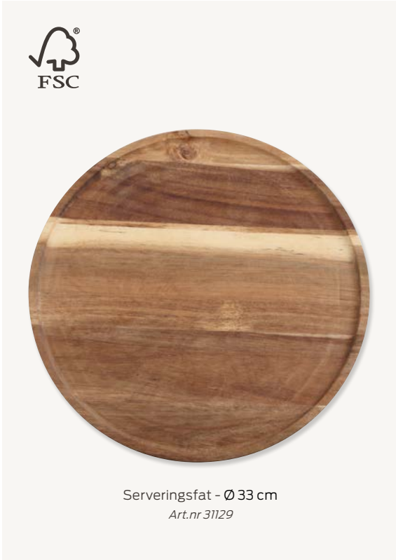
Serveringsfat - Ø 33 cm Art.nr 31129