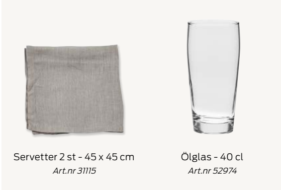
Servetter 2 st - 45 x 45 cm Art.nr 31115