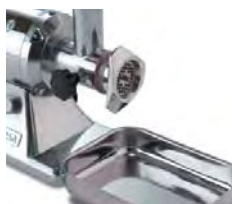
W standardzie miska odbierająca ze stali nierdzewnej