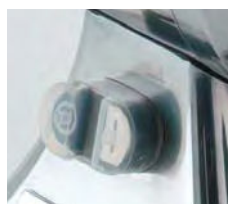
Funkcjonalny i bezpieczny włącznik