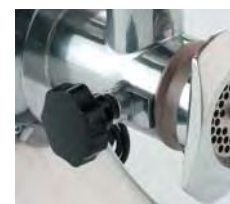
Łatwo demontowalna przystawka ułatwiająca czyszczenie