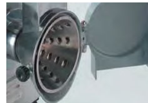
Stożek do ścierania mozzarelli (otwory 7 mm)